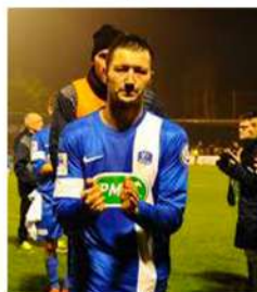
20 JANVIER 2016 16e de finale de coupe de France face à Troyes (ligue 1 à l'époque)