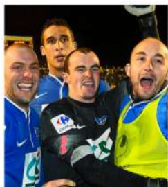
05 MARS 2015 ¼ de finaliste de Coupe de France face à l'EA