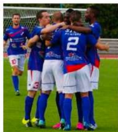
4 JUIN 2016 Champion de CFA et montée en National.