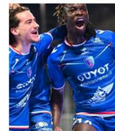
5 AOÛT 2023 Premier match de Ligue 2 dans l'histoire du club (vs SC Bastia).