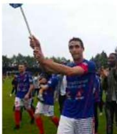
DÉCEMBRE 2016 Champion d'automne de National