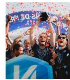
23 MAI 2023 Champion de National et montée en Ligue 2.