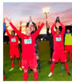
23 JANVIER 2018 16e de finale de coupe de France face à Granville